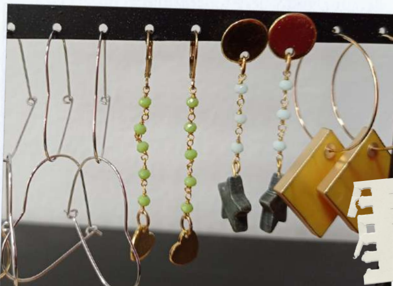
Art. 23 orecchini diversi soggetti €10 cad