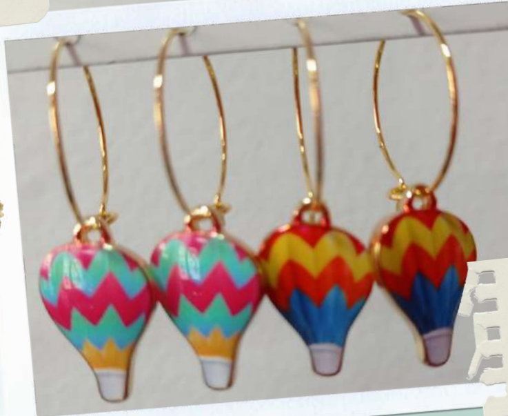
Art. 24 Orecchini con diversi soggetti € 10 cad