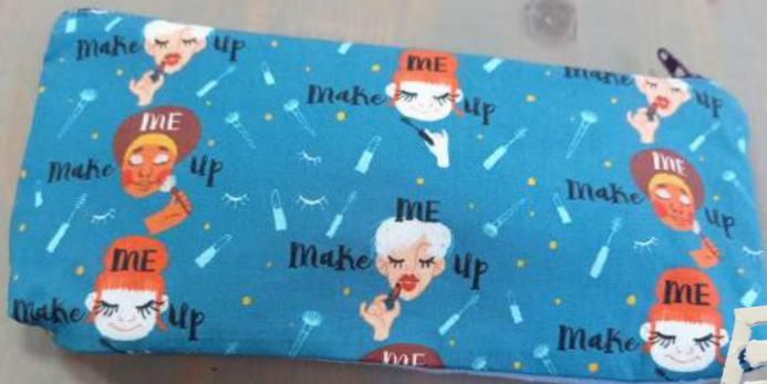
Art. 34 Pochette € 7