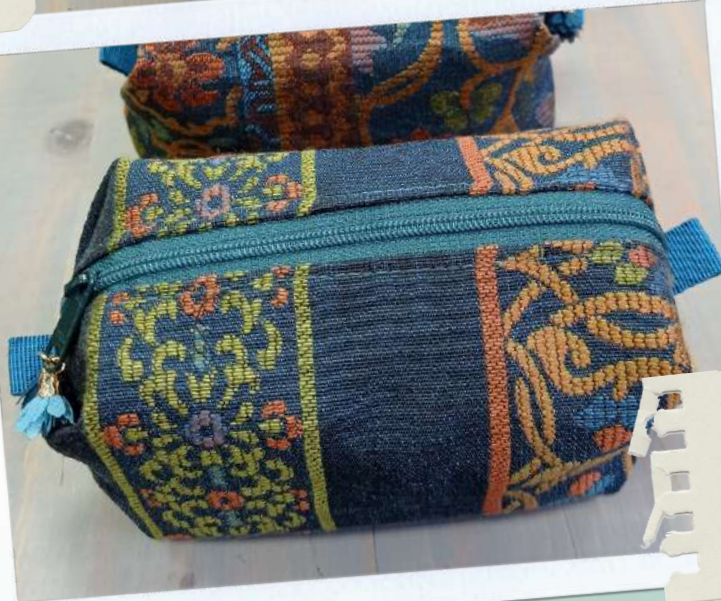
Art. 32 Pochette diversi colori € 15 cad